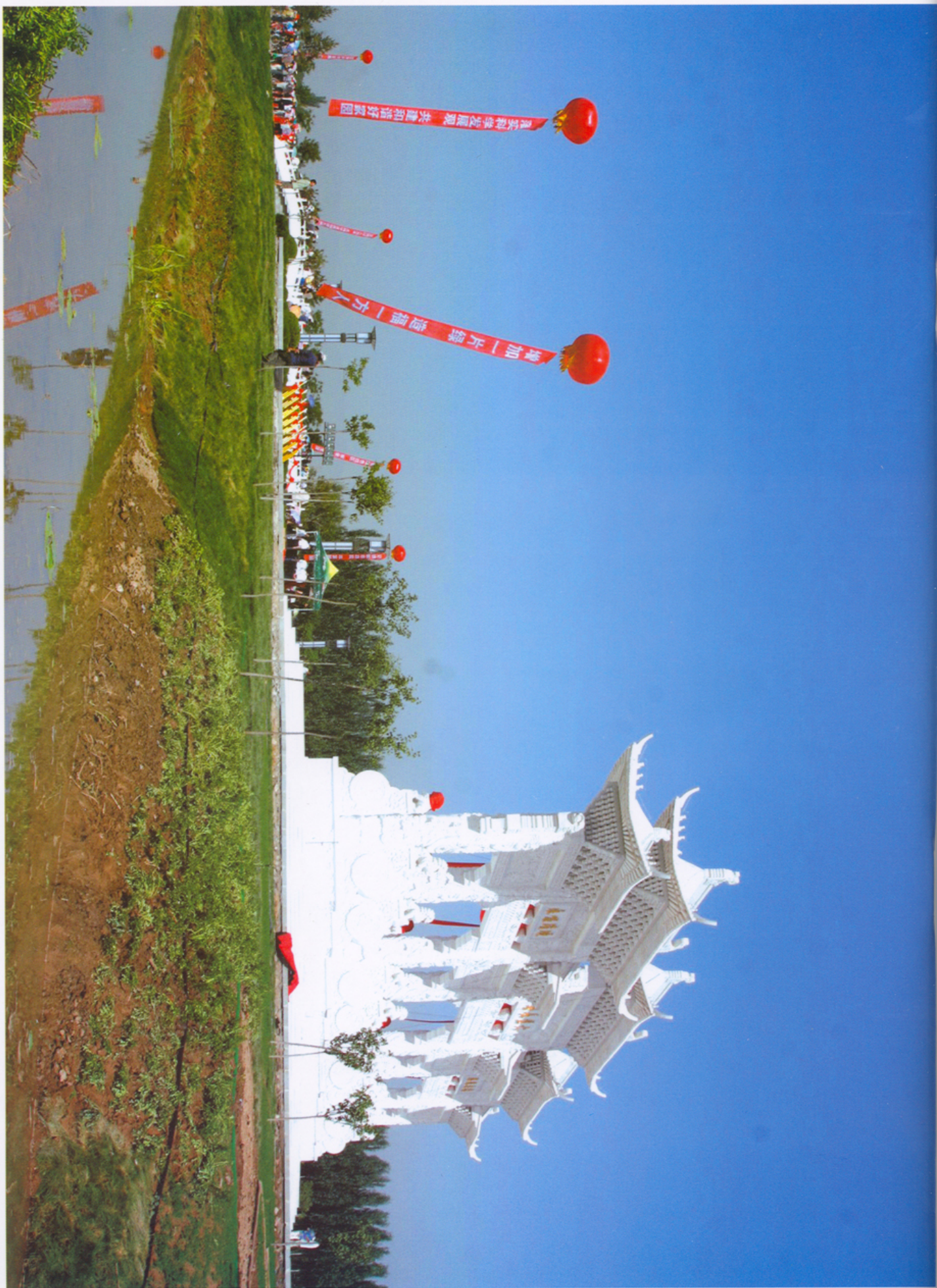
妖娆塞上牌坊公园