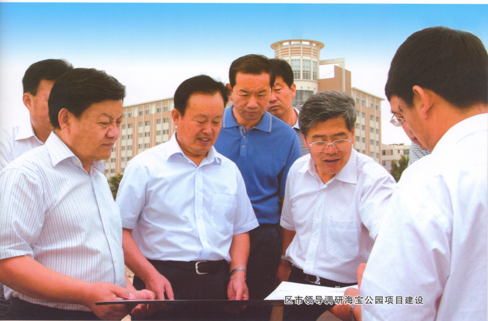
区市领导调研海宝公园项目建设