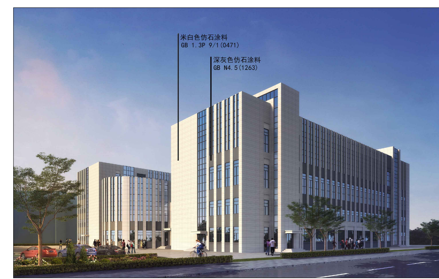
沿贺兰山西路透视图