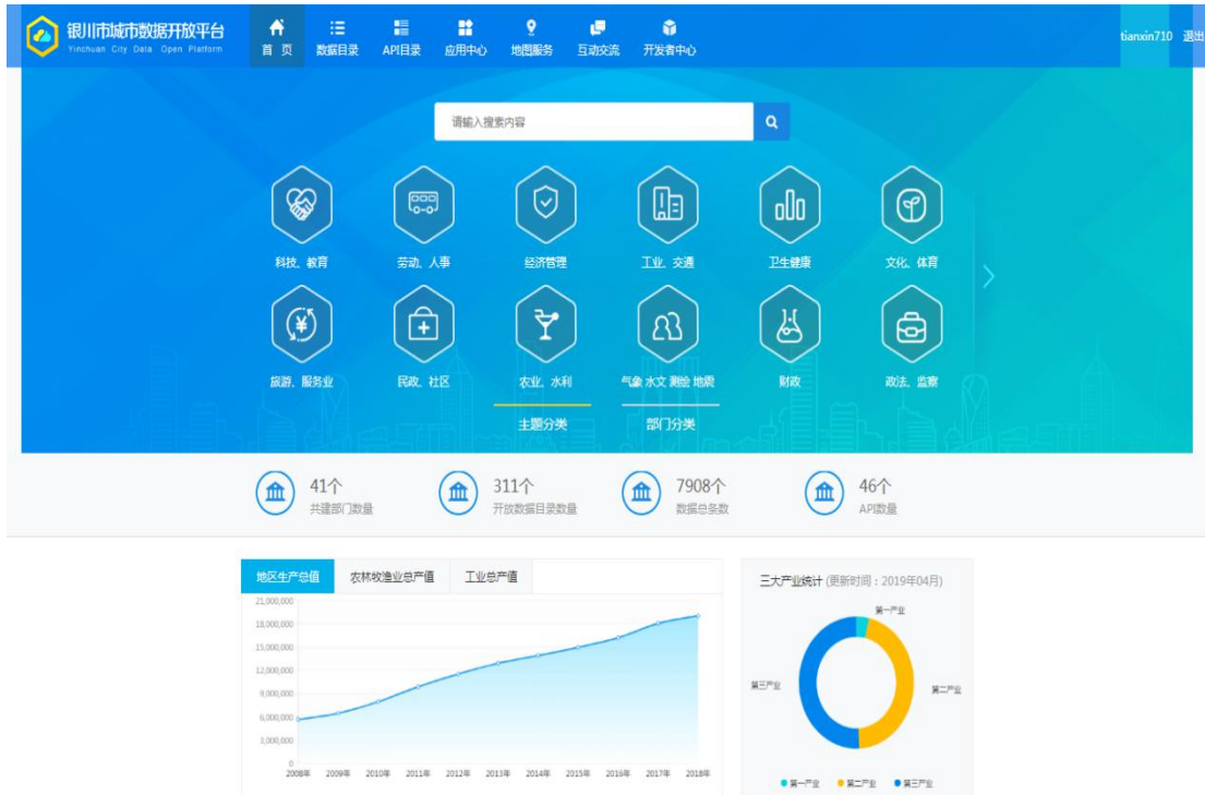
图 4 银川市政务数据共享开放平台