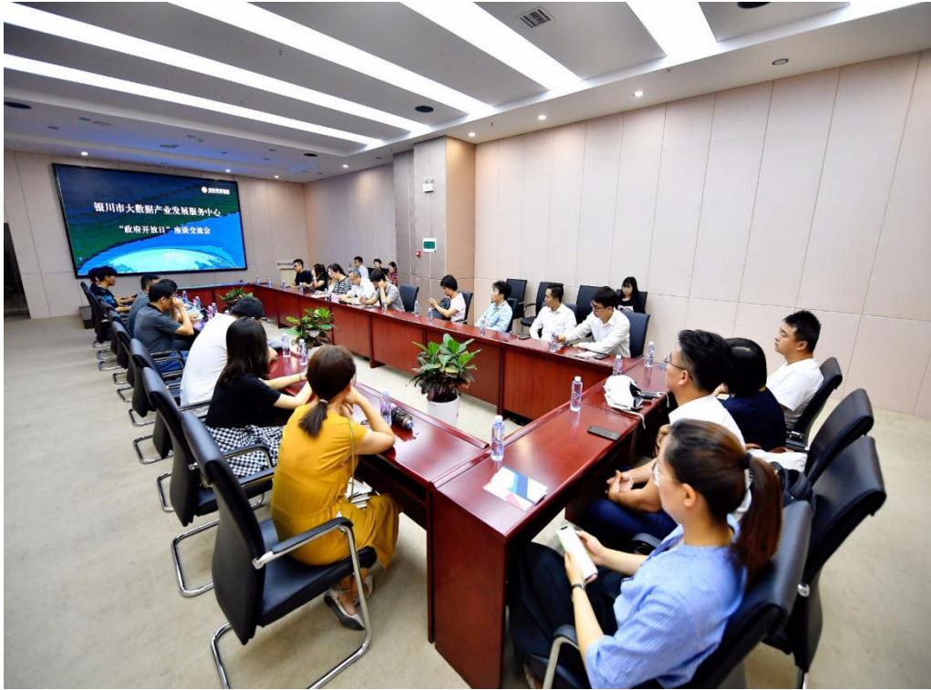
图 5 “政府开放日”活动座谈交流环节

2. 积极组织政务公开工作人员参加 2019 年全市政务公开专题培训班（第一期）以及积极参加银川市人民政府办公室举办的 2019 年全市政务公开专题培训班（第二期）。积极组织负责政府信息公开工作的领导和各科室工作人员认真学习 2019 年最新修订的《条例》，并熟悉掌握《条例》相关规定，确保政府信息公开工作在规范的前提下顺利进行。