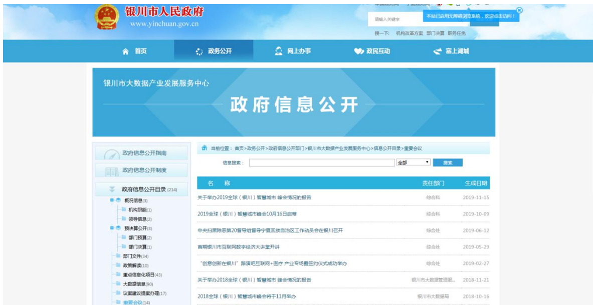
图2 银川市人民政府网站主动公开情况

2019年，银川市大数据产业发展服务中心通过银川市人民政府网站主动公开政府信息共90条，其中概况信息2条、预决算公开2条、部门文件6条、政策解读2条、重点信息化项目11条、大数据信息59条、议案建议提案办理3条、重要会议5条，确保政府信息公开各项重点工作落到实处